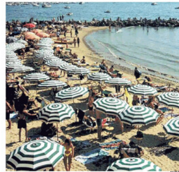
Due anni e poi le concessioni per le spiagge non saranno più valide

no uguali, ma i numeri fanno impressione. Il Demanio incassa poco più di cento milioni di euro l'anno, la metà di quel che sulla carta dovrebbe (è alto il tasso di evasione), ma soprattutto si tratta di una frazione dei fatturati del settore. Non tutte le spiagge sono uguali, ma qui basti citare il caso del Twiga di Flavio Briatore, a Marina di Pietrasanta. Lo ricorda il verde Angelo Bonelli, da anni impegnato nella battaglia per il superamento del privilegio. Lo Stato incassa da Briatore 17mila euro l'anno a fronte