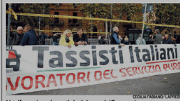
Manifestazione davanti al ministero dei Trasporti

Inoltre «deve essere rispettato il principio di territorialità e ognuno deve operare nel proprio territorio, dove ha ricevuto l'autorizzazione e la li-